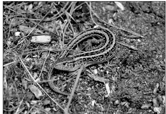
Männliche Zauneidechse 2018

Mitglied im BUND und Landesanglerverband