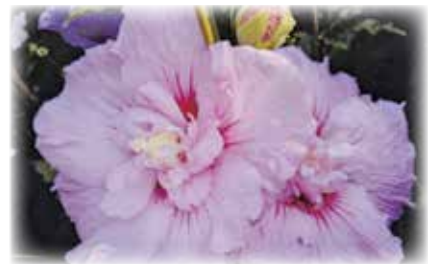
Neue Sorten im Angebot

bis Anfang Oktober blühend in Augenschein zu nehmen. Es soll eine kleine Attraktion in Müllrose werden, deshalb ist auch ein kleiner 2 Meter Urweltmammutbaum (Metasequoia glyptostroboides) gepflanzt worden, der bis 1940 nur als Fossil bekannt war. An keinem Ort in Deutschland wird es möglich sein eine „Minibaumschule“ mit etwa 5000 Stück Roseneibischen“ einschließlich Jungpflanzenzuchten und tausenden auch gefüllte Blüten zu bewundern. Millionen Insekten vor allem Hummeln und Bienen finden hier im Sommer bis in den Herbst ausreichend Nektar. Vom Parkplatz (Markt Müllrose) etwa 15 Minuten an der Kirche und Marina vorbei, der rechtsabbiegenden Betonstraße folgen. Ein schöner Naturspaziergang für die ganze Familie durch Wiesen an Pferde- und Eselkoppel vorbei, lädt dazu ein. Bei Interesse an genannten Angeboten