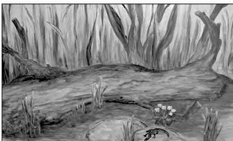
gemalt in Acrylfarbe