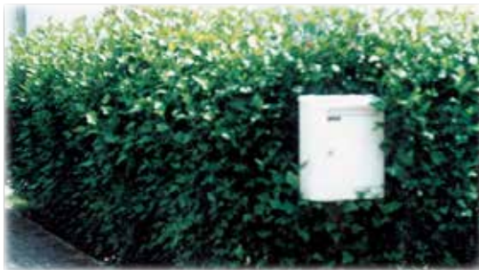
Eibischhecke - durch den aufrechten Wuchs und die glänzenden Blätter auch ohne Blüten gut anzusehen.

das heißt auch letztlich für die Menschheit- und Tierwelt. Wissenschaftler haben schon lange vor dem weiteren Rückgang der Insektenhäufigkeit gewarnt. Naturfreunden ist aufgefallen, dass die Anzahl der Singvögel mangels Futter beträchtlich abgenommen hat. Ohne Bienen und Hummel wäre die menschliche Ernährung katastrophal eingeschränkt. Koniferen, die am häufigsten verwendeten Heckengehölze, sind preiswert und anspruchslos. Wohngebiete wirken dadurch düster und trist. Ältere Koniferenhecken neigen zur Verkahlung und werden von Jahr zu Jahr breiter. Herbst, Frühling und Sommer machen bei Koniferen kaum sichtbare Unterschiede. Der Nutzen für Insekten ist unbedeutend. In den Mittelmeerländern werden eher Blütenhecke, wie Oleander und Roseneibisch gepflanzt, was Urlaubern so angenehm auffällt. Roseneibisch ist für Bienen so sehr geeignet, weil er als Sommerblüher bis in den Herbst hinein blüht,