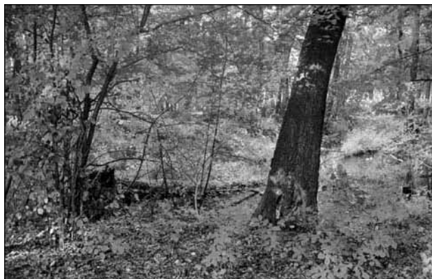
Altarm der Spree am Bunten Schütz bald alles zugewachsen, keine Fische und Frösche mehr vorhanden.